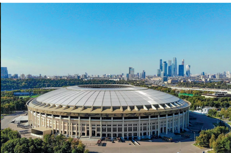
Лужнецкий мост и стадион Лужники