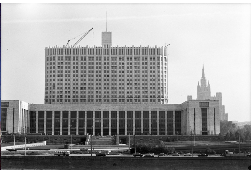
Проект дома Аэрофлота и дом Правительства

«Белый дом», он же дом Правительства был построен в 1979 году как дом Советов РСФСР по проекту архитектора Дмитрия Чечулина. Для постройки этого здания он использовал свои наработки для дома Аэрофлота, который в своё время так и не был построен.