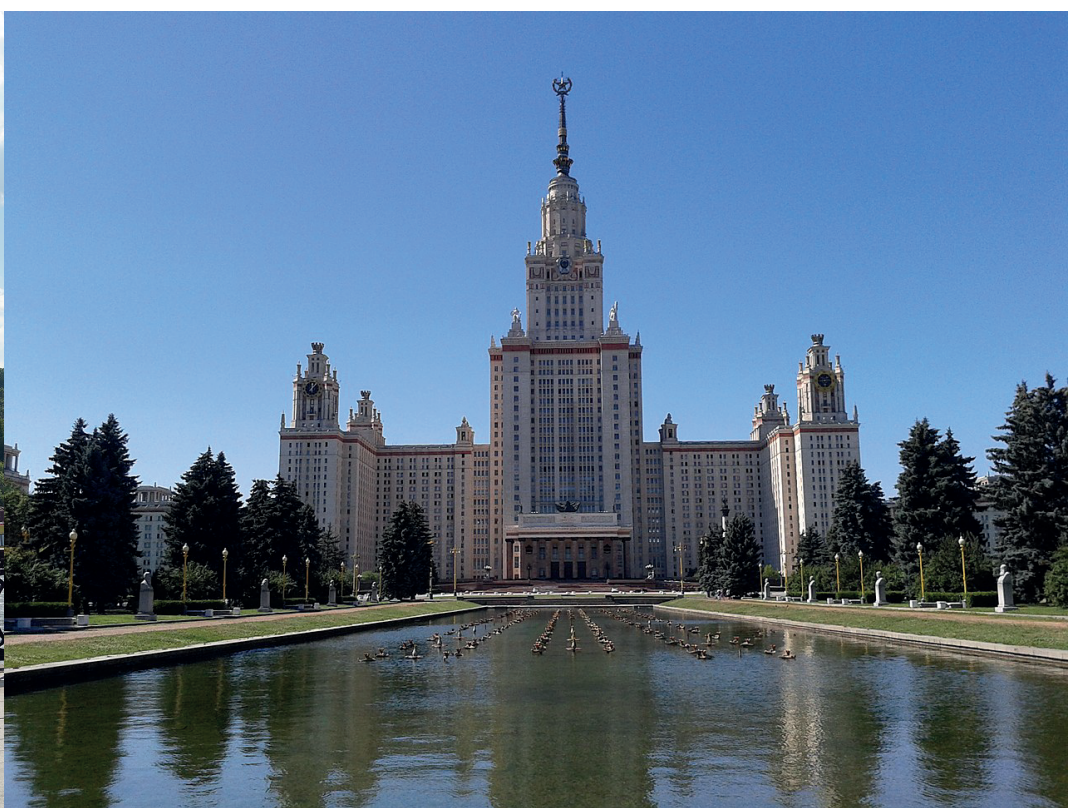
Канатная дорога и здание МГУ

На другой стороне находится одно из самых высоких и панорамных мест Москвы – Воробьёвы горы. Множество раз этот вид изображали художники, до революции здесь находился ресторан Крынкина – один из самых известных. Сейчас – смотровая площадка, куда постоянно приезжают туристы.