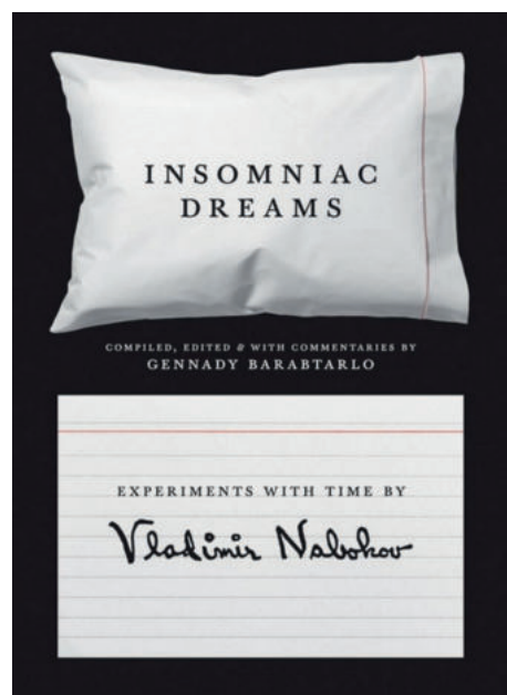
Дневник снов Владимира Набокова

◆ Дневник — энергия преобразований. Назначьте вместе с детьми важные функции дневнику, заведите несколько: по придуманной книге, по приметам времени, по воспоминаниям и так далее. Полезный инструмент — дневник наблюдений. За расписанием кошки, за своими эмоциями, за списком интересных снов, книг и фильмов.