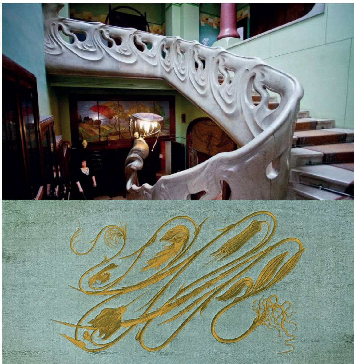
Особняк Рябушинского (1902) и «Удар бича» Германа Обриста (1895)