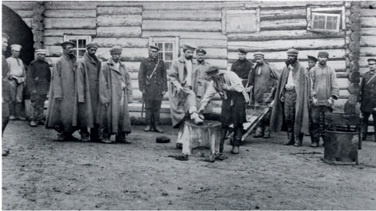
Чехов на Сахалине