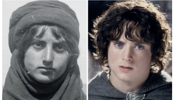
Элайджа Вуд и женщина-бедуин

пример 2 Опросники и анкеты — одно из популярных детских развлечений. Вспомните вопросы Энди Уорхола или опросник Марселя Пруста (пусть он еще не детский герой, но позже им будет приятно встретиться с произведениями автора, который им уже знаком). Предложите ответить за выбранного героя на их вопросы, ориентируясь на высказывания, произведения, мемуары (то, что он оставил) героя. Если дети сами ведут такие анкеты, предложите им воспользоваться своими форматами и записать ответы за героя.