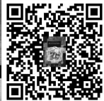
Книга в Литрес